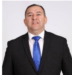
Senador Líder Amarilla Ríos Relator