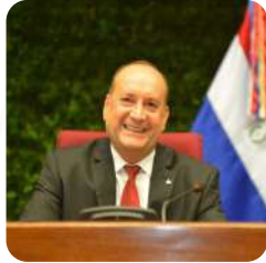
Senador Oscar R. Salomón Presidente Honorable Cámara de Senadores