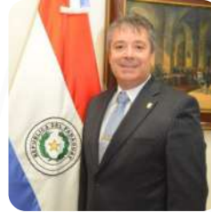
Diputado José María López Presidente Honorable Cámara de Diputados

Como poder del Estado que administra la República presentamos la nueva versión del Plan Estratégico Institucional del Poder Legislativo, que abarca los años 2022 - 2026.