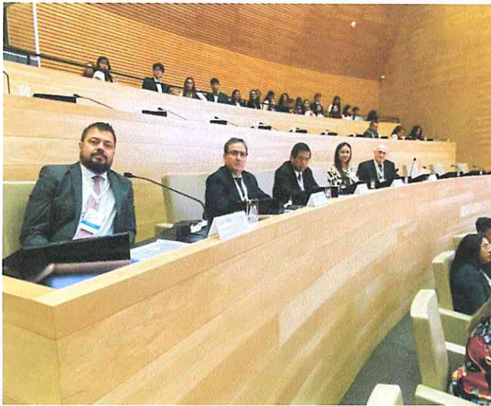
-Imágenes tomadas en oportunidad de las sesiones llevadas a cabo-